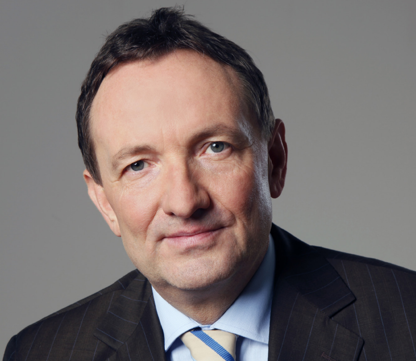
Dr. Holger Poppenhäger, Thüringer Minister für Inneres und Kommunales

rechtlichen Handlungsmöglichkeiten im Zusammenhang mit Veranstaltungen und Versammlungen von Rechtsextremisten an Gedenktagen, insbesondere am Volkstrauertag und Totensonntag, thematisiert. Weiter beschäftigt sich der Handlungsleitfaden mit Immobiliengeschäften, die von Personen aus dem rechtsextremistischen Spektrum getätigt werden, und zeigt die rechtlichen Handlungsmöglichkeiten auf, um einen entsprechenden Immobilienerwerb zu erkennen und gegebenenfalls zu verhindern. Eine bessere Vernetzung der beteiligten Stellen ist ein weiterer Schwerpunkt dieses Handlungsleitfadens.